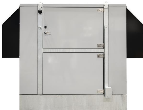
Aggregatet på bilden är extrautrustat med snöhuvar

Generatoraggregatet är utrustat med en överdimensionerad generator, för att säkerställa en hög kortslutningsström och ökad säkerhet i selektivitet och utlösningsvillkor. Aktuell generator på 35 kVA ger en långvarig (10 sekunder) kortslutningsström på ca 175A och en momentan (under 0,03 sekunder) på ca 200A.